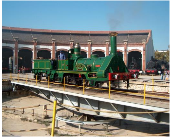
Reproduction du « Mataró » sur la plaque tournante.

En outre, le festival souhaite donner un aperçu plus large de la technologie de la vapeur, qui ne se limitera pas au domaine ferroviaire, grâce à la présence d'autres véhicules basés sur la machine à vapeur, tels que des tracteurs et des moteurs statiques. Par exemple, le service des pompiers de Barcelone participera au festival de la vapeur avec sa pompe à vapeur de lutte contre les incendies datant du XIXe siècle et construite à Londres par la société Merryweather. Les pompiers montreront comment éteindre un incendie avec cette technologie de pointe de l'époque. L'événement bénéficie de la collaboration de la mairie de Móra la Nova, de la Fundación de los Ferrocarr-