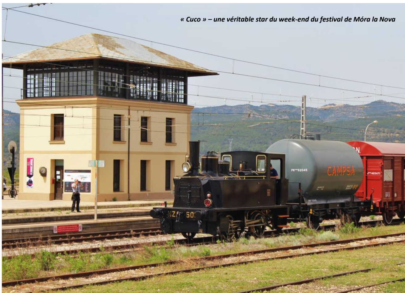
« Cuco » – une véritable star du week-end du festival de Móra la Nova