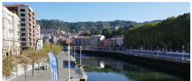
Ria de Bilbao.

La réunion et la conférence annuelles 2024 de la FEDECRAIL se tiendront à Bilbao, en Espagne, du jeudi 2 au dimanche 5 mai. Le 2 mai, une réunion de bienvenue sera organisée en guise d'introduction. Le 3 mai suivront des réunions de groupes de travail, des réunions du conseil d'administration et des conférences intéressantes sur l'histoire du patrimoine culturel mobile, le marketing et l'identité pour nos musées/trains touristiques/tramways et d'autres sujets intéressants. L'assemblée générale annuelle aura lieu le samedi matin 4 mai. La soirée sera placée sous le signe du 30e anniversaire de FEDECRAIL. Le dimanche, une visite d'une journée entière est prévue chez notre membre Euskotren Museum à Azpeitia ( https://museoa.euskotren.eus/ ). Un programme de partenariat avec une visite de la vieille ville de Bilbao et du musée Guggenheim est également au programme. Plus d'informations prochainement www.fedecrail.org