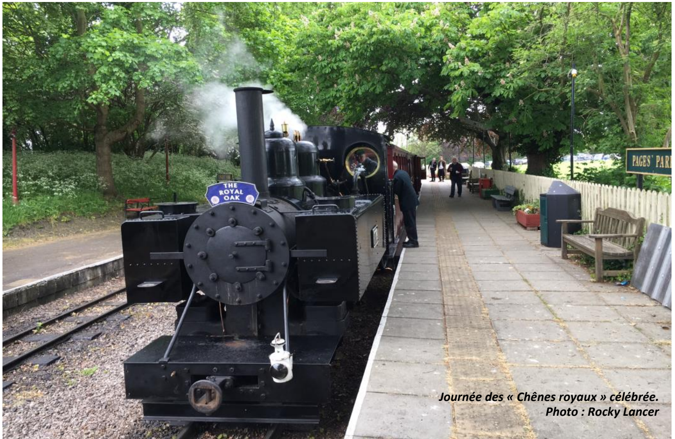
Journée des « Chênes royaux » célébrée.

Charles II s'est caché dans le Royal Oak, un chêne anglais, dans le bois de Boscobel, pour échapper à ses poursuivants des têtes rondes. Neuf ans plus tard, le 29 mai, jour de son anniversaire, Charles II restauré est monté triomphalement sur le trône à Londres. À partir de 1660, la Restauration a été célébrée comme une fête nationale, jusqu'à ce que les Victoriens l'abolissent en 1859.