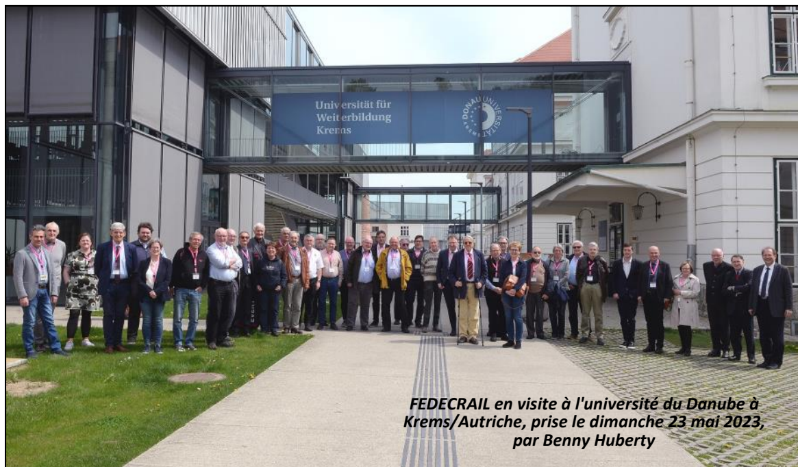
FEDECRAIL en visite à l'université du Danube à KREMS/Autriche, prise le dimanche 23 mai 2023, par Benny Huberty