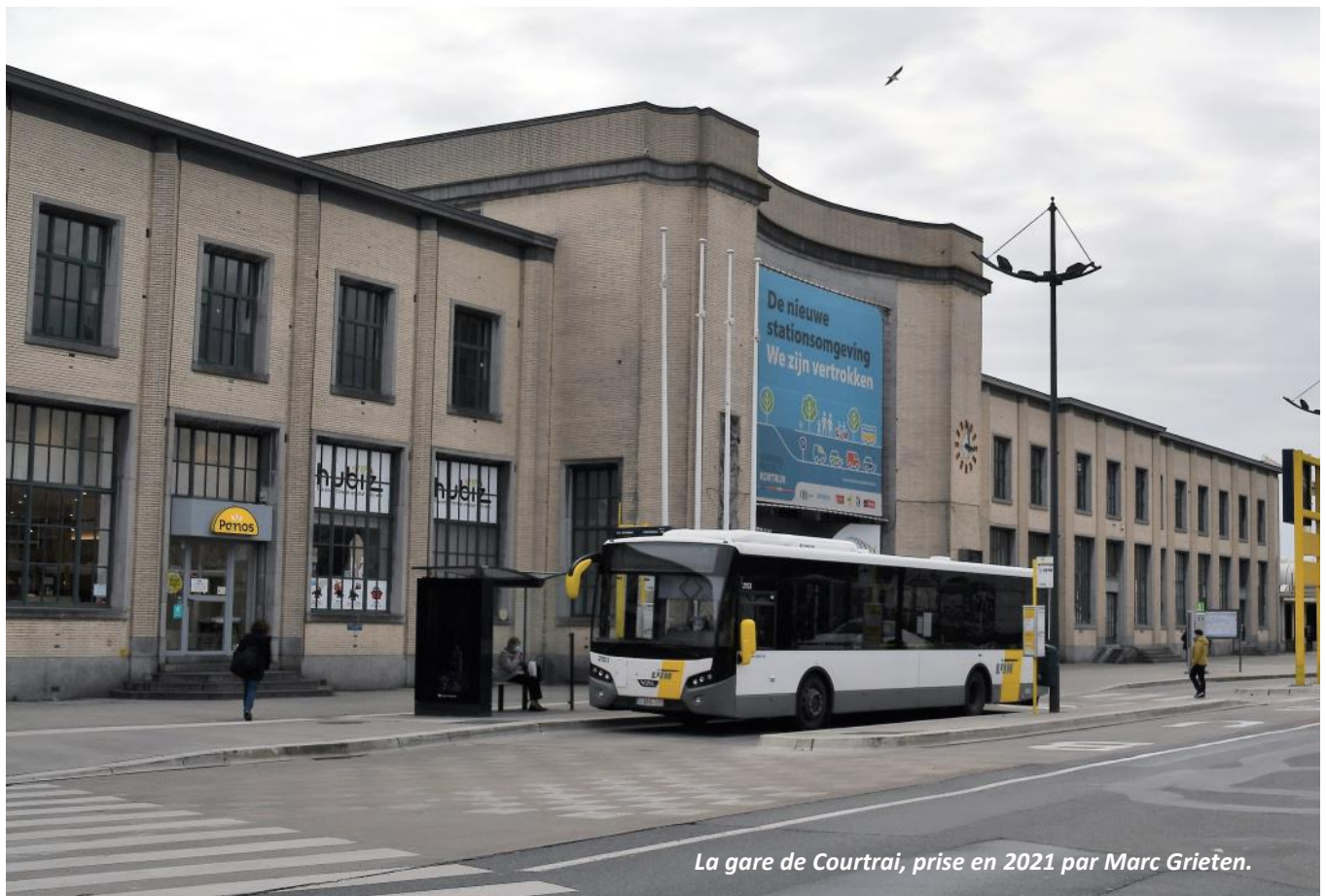
La gare de Courtrai