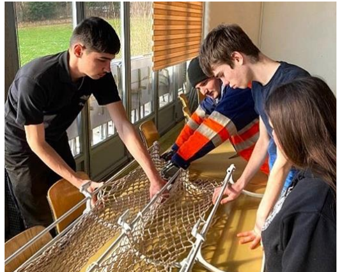
Les jeunes tissent des réseaux.

Construite en 1902 pour la riche clientèle des RhB entre Chur et St-Moritz, la voiture salon As n°2 est arrivée au Blonay Chamby en 1972. Elle est utilisée comme boutique du rail puis avec la création d'un bâtiment d'accueil moderne, une remise en circulation est envisageable. À cette occasion, la voiture salon retrouve son prestige et se voit même munie d'un bar. Depuis son inauguration en 1999, elle ne connaît pas de révision majeure. Sa couleur